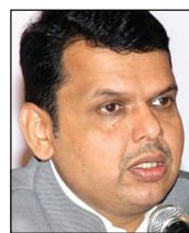
देवेन्द्र फडनवीस मुख्यमंत्री